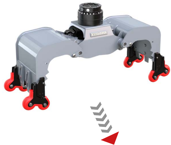
Préhension douce des surfaces lisses