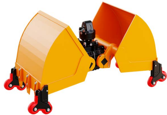
Presca delicata su superfici lisce