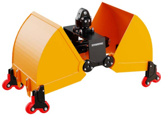
Presca precisa di oggetti molto stretti