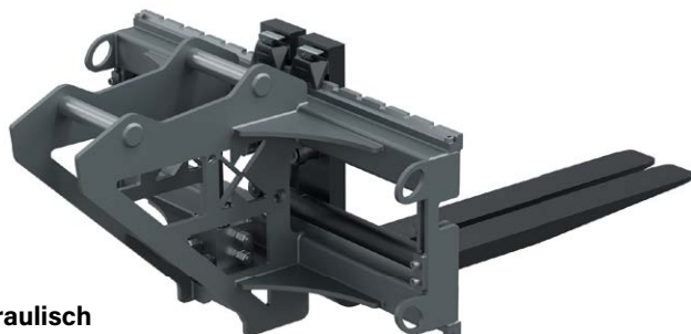
Hydraulisch verstellbare Palettengabel