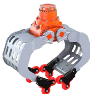
en option: 4-Grip, ici avec D06HPX