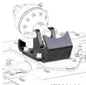
KM 381 08

Variante : d'autres hauteurs que celles mentionnées sont possibles