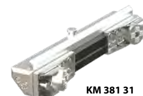
KM 381 31