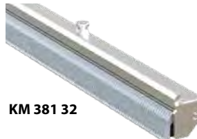
KM 381 32