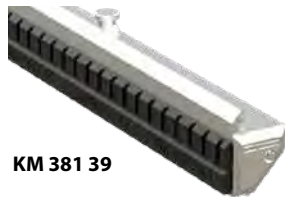
KM 381 39