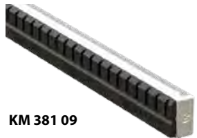
KM 381 09