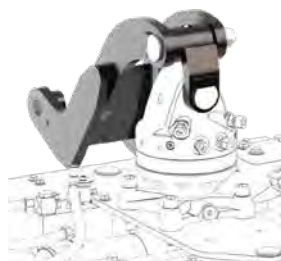
KM 381 18