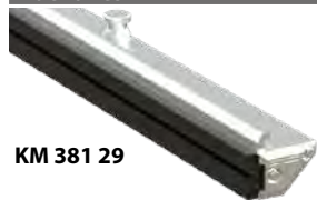
KM 381 29