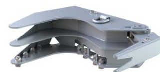
KTC08 modulo pinza singolo