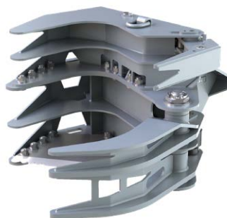
KTC08 con modulo pinza